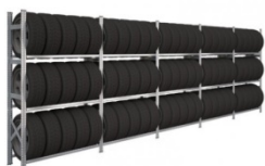
Typisk maxhøjde for reoler på indskudt dæk, kælder m.m.